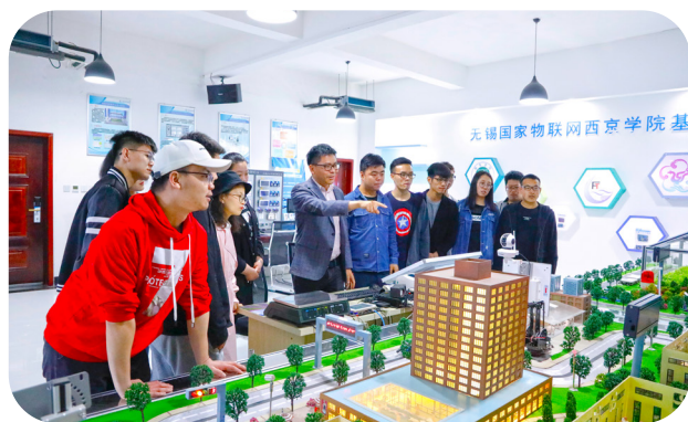
[ 现代果业数智化工程陕西省高校工程研究中心 ]