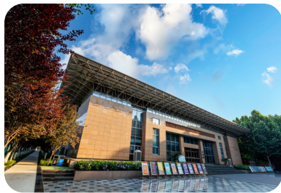
[大学生发展与服务中心]