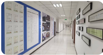
[ 研究生工作室 ]