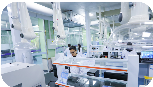
[ 西安市先进光电子材料与能源转换器件重点实验室 ]