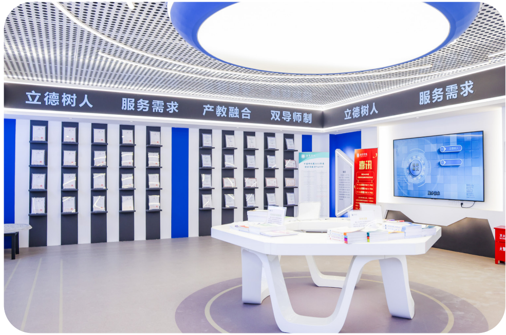
[ 研究生创新成果展室 ]