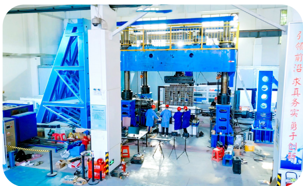
[ 陕西省混凝土结构安全与耐久性重点实验室 ]