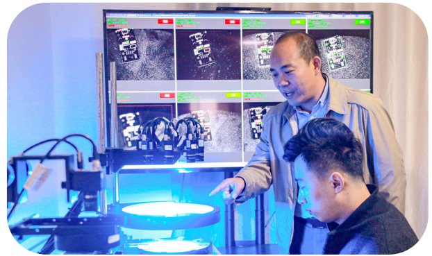
[ 西安市高精密工业智能视觉测量技术重点实验室 ]