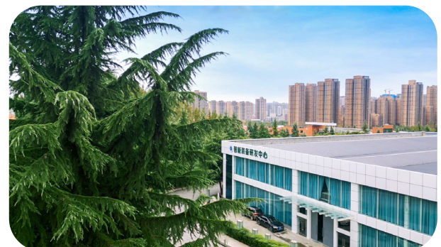
[ 智能装备研发中心 ]