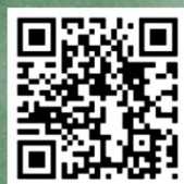
西京学院720°全景看校二维码